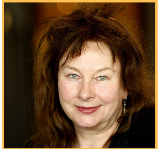
Yolande Moreau, marraine d'Eqla.

accéder à la lecture via les formats audio, nous avons aussi demandé à 12 célébrités de prêter leur voix à celles et ceux qui lisent autrement. Des « voix » francophones comme Yolande Moreau, Bouli Lanners, Bruno Coppens, Fabrizio Rongione et beaucoup d'autres ont ainsi accepté d'enregistrer ces nouvelles dans les studios d'Eqla. Une belle marque de sympathie et de soutien pour laquelle nous les remercions chaleureusement ! Ces nouvelles seront diffusées dès le 19 janvier 2022 via notre site de campagne, nos réseaux sociaux, mais aussi les plateformes Spotify, Apple Music et Deezer, à raison d'une nouvelle par mois. Envie de découvrir ces récits passionnants ? Alors, à vos écouteurs : lisez !