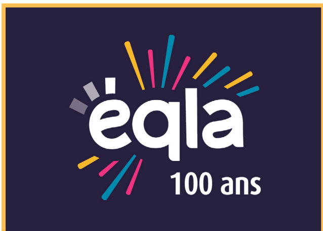
Le logo du centenaire d'Eqla.