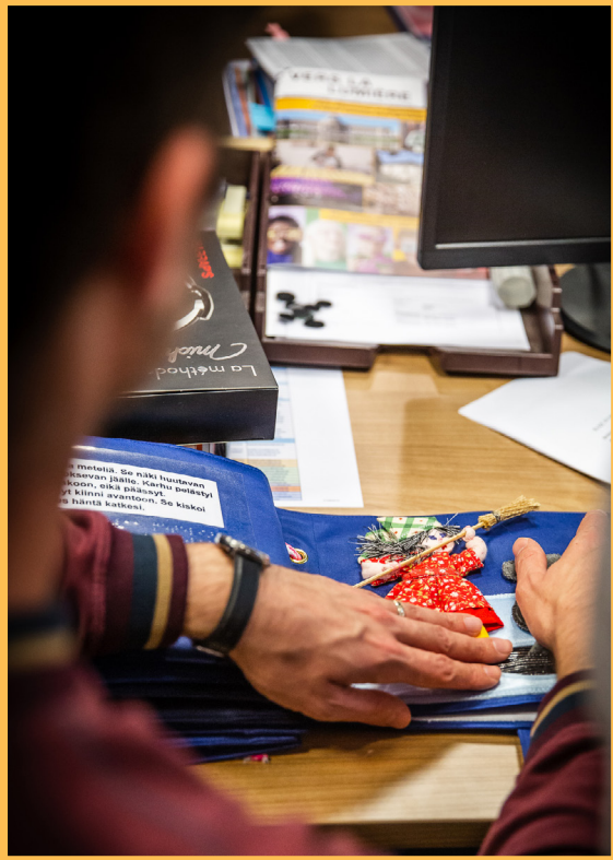
Les livres tactiles : inclusifs et beaux.

UN APRÈS-MIDI POUR SE PLONGER DANS LES LIVRES TACTILES