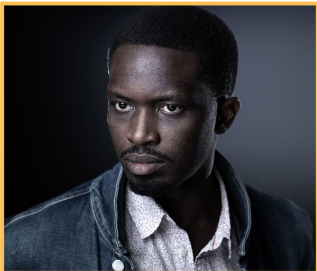
Mohamed Mbougar Sarr, prix Goncourt 2021.

Les prix littéraires de cette année ont comme un air d'outre-Méditerranée : les écrivains africains se taillent la part du lion.