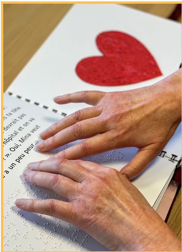
Le catalogue de livres s'étoffe.

Chaque lecteur et lectrice en ordre de cotisation reçoit durant le printemps les suppléments au catalogue reprenant la liste des nouvelles acquisitions de la bibliothèque, en fonction de son support de lecture.