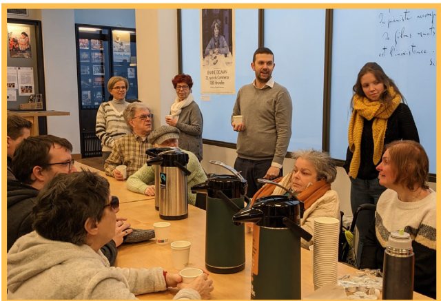
Les membres du panel.

La plateforme pour l'accessibilité à l'audiovisuel – représentée par les trois associations typhlophiles Eqla, Les Amis des Aveugles et La Lumière – a été créée en 2016 en vue de parler d'une seule voix en faveur du développement de l'accessibilité à l'audiovisuel en Fédération Wallonie-Bruxelles.