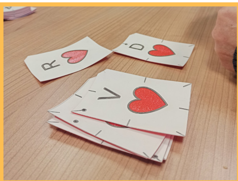
Un jeu de cartes accessibles.

➤ Ce prototype d'adaptation a éveillé la curiosité de l'ensemble du groupe. Cela a confirmé l'envie de la ludo de se lancer dans ce projet. Il faudra toutefois revoir la représentation tactile et les matériaux utilisés, trop instables et difficilement perceptibles au toucher.