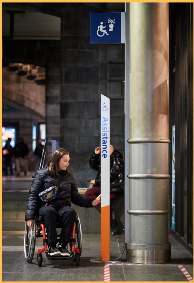
Une borne d'assistance de la SNCB.