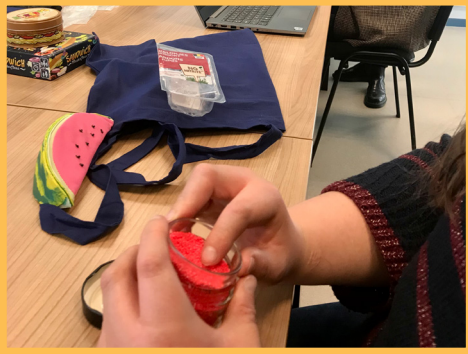
Sandwich, un jeu adapté par Eqla.