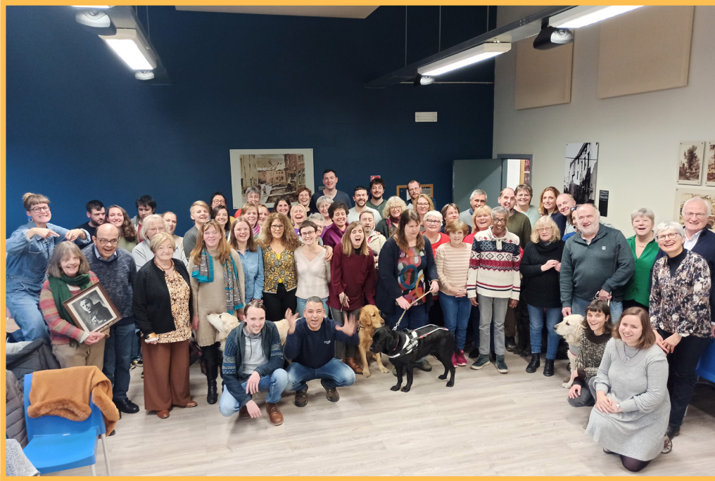
"Paul Culture", le jeu organisé pour nos membres à l'occasion des 100 ans d'Eqla.

et la communication qui se mettent en place dans un jeu coopératif d'échappement game t'intriguent ? Alors viens apprendre à animer l'échappement game accessible Lucky Luke que nous proposons à l'aveugle dans le cadre de Team buildings.