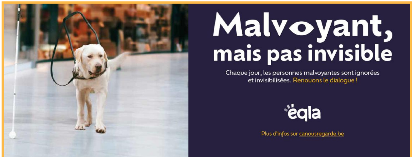
Visuel de la campagne "Ça nous regarde 2024 - Malvoyant mais pas invisible"

Cette année encore, Eqla s'est illustrée à travers de nombreuses campagnes de presse dont quatre qui ont été sensiblement plus marquantes.