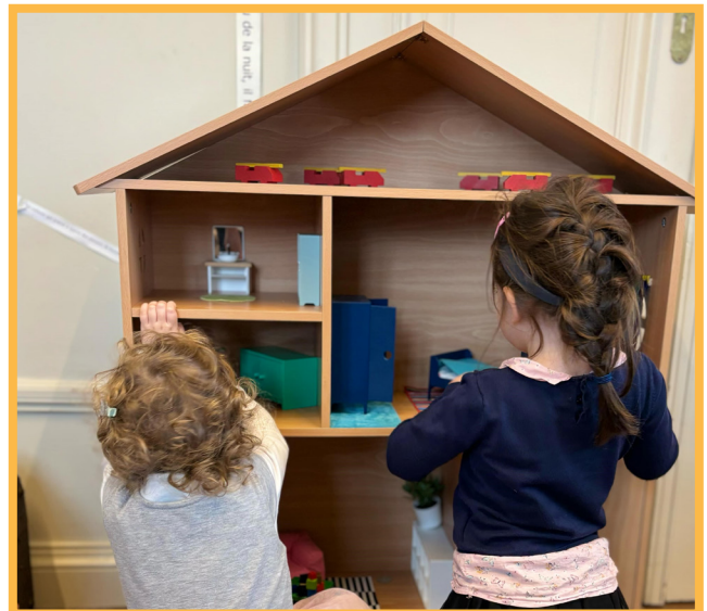
Deux petites filles devant une maison de poupée à la rencontre Jeu t'aime

Enfin nous avons proposé une activité créative pour dire je t'aime à l'élue de son cœur en décorant une carte de tissus, pour qu'elle devienne tactile, et de braille, pour la rendre accessible.