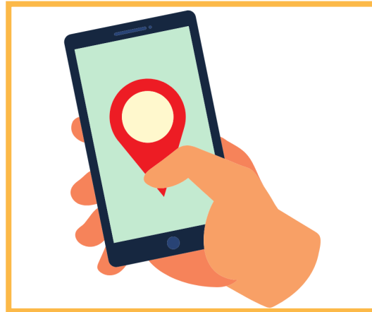
Une icône de localisation sur un téléphone tenu en main

En activant la fonction « Localiser mon iPhone », il a suivi en temps réel la position de son téléphone et pris les mesures nécessaires pour le récupérer.