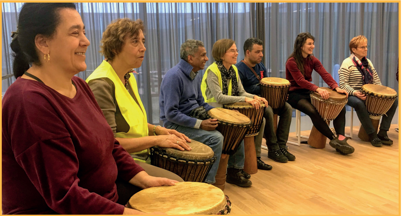
Photo d'un atelier musique du Musée de l'Afrique central de Bruxelles avec des membres d'Eqla

Notre équipe attache également beaucoup d'importance à rendre disponibles des textes écrits (roman, poésie, essai, etc.) qui ne trouvent pas leur équivalent audio dans les productions éditoriales commerciales. Ainsi, les livres, supports et productions abordés dans le cadre de ce programme seront adaptés en audio dans notre studio d'enregistrement.