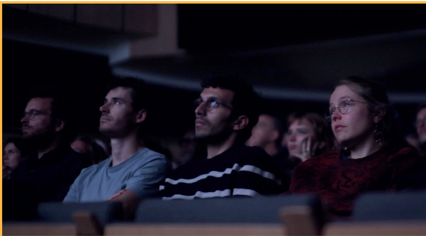
Photo du public assistant à la projection du court métrage "À travers ses yeux".