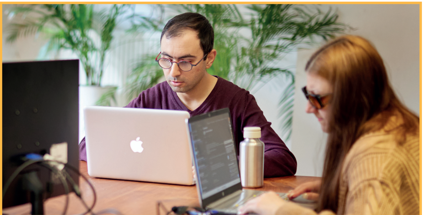
Photo de deux personnes devant leur pc

N'hésitez pas à nous faire part de vos retours ou à nous proposer d'autres alternatives numériques accessibles par mail à : nt@eqla.be .