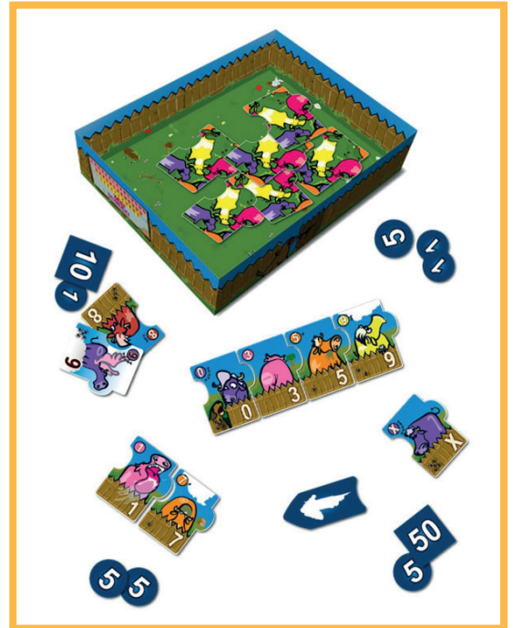
Photo du jeu Mow Access non adapté

Le but de ce jeu consiste à avoir le moins de points mouches dans son étable en se débarrassant du maximum de ses cartes vaches. Plusieurs allers-retours entre le Fablab et la ludo ont permis au jeu d'acquérir une meilleure stabilité, un meilleur contraste, une figurine vache imprimée en 3D indiquant le sens de jeu, un système numéraire tactile ou encore une organisation des pièces de jeu à l'aide des boîtes de défausse.