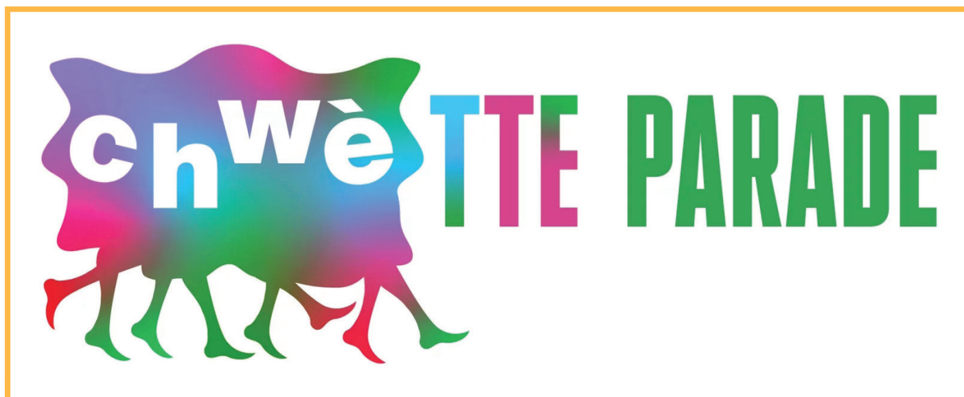
Logo de la Chwètte Parade

La Chwètte Parade, mais qu'est-ce donc ? Comme son nom l'indique, il s'agit d'une parade. Elle signale l'arrivée des beaux jours sous le signe de la créativité et de la convivialité.