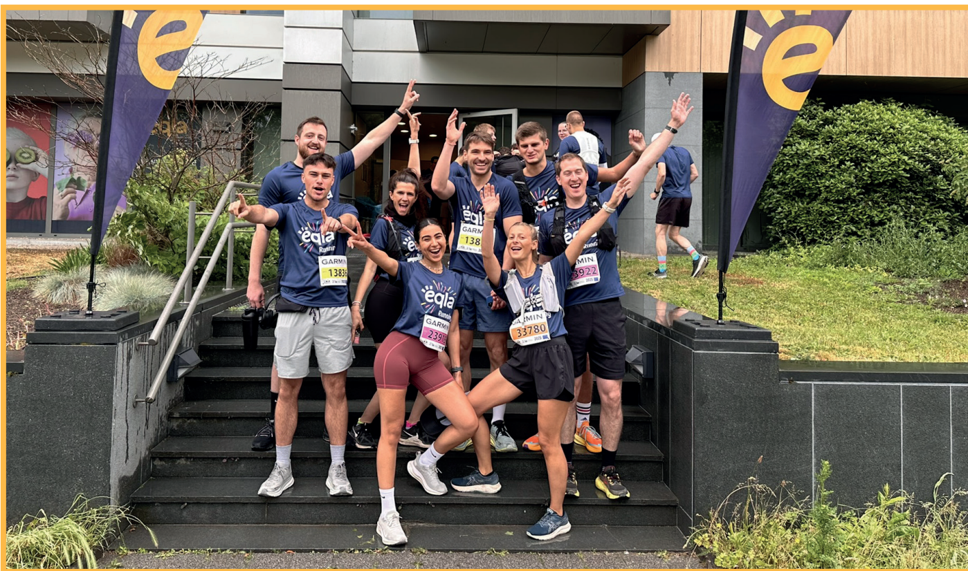
Photo de participants au 20km de Bruxelles avec Eqla lors de l'édition 2025