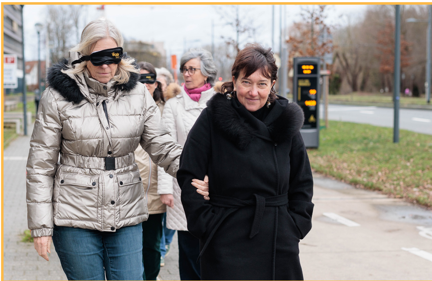
Photo d'une mise en situation des déplacements lors de notre formation sur la déficience visuelle. On y voit deux femmes, l'une a les yeux bandés et tient le coude de l'autre femme.