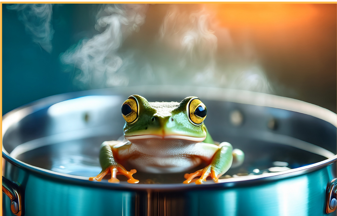
Photo d'une grenouille baignant dans une marmite d'eau chaude.