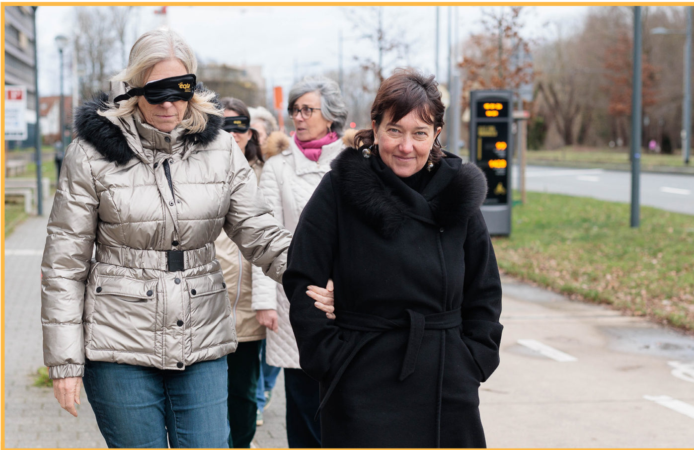
Photo d'une mise en situation des déplacements lors de notre formation sur la déficience visuelle. On y voit deux femmes, l'une a les yeux bandés et tient le coude de l'autre femme.